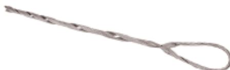
Imagen 01 Remate Preformado

Los preformados para fibra óptica, están formados por potentes alambres helicoidales de acero para distribuir de manera homogénea, la fuerza de agarre y tensión. Destinados para el perfecto anclaje del cable mensajero o de retenida que soportan los cables de fibra óptica.