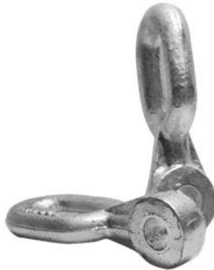
Imagen 01: Eslabón Ojo Revirado

Fabricado en hierro nodular galvanizado por inmersión en caliente para asegurar una alta resistencia a la corrosión, también conocido como eslabón de cadena de ojo forjado o eslabón de ojo torcido para línea de poste, sirve de enlace entre el herraje extremo de unión con el apoyo y el sistema de fijación del cable