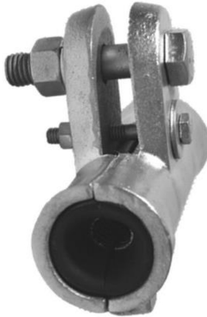
Imagen 01: Grapa Trunion

Esta grapa ha sido fabricada en aleación de aluminio mediante fundición artesanal, el material fundido se aporta manualmente dentro del molde enterrado en arena. Este herraje es utilizado para suspender el cable en los postes en tramos de línea directa sin ningún cambio de dirección. Aplica en zonas cuyos vanos superan los 600 metros.